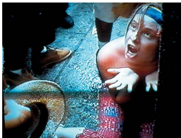
Alkohol a sexuální násilí. „Obyčejní muži, kteří moc pijí.“ Tak charakterizoval New York Times mužský gang, který zcela neskrývaně napadl bezmála 50 žen během slavnostního průvodu v New Yorku v červnu 2000. „Silně posílnění alkoholem neváhali na ženy pořávat, hrubě se jich dotýkat, polévat je vodou a strhávat z nich svrčky.“ (Staples, 2000)

U mužů testosteron zvyšuje poměr šířky obličeje a tělesné výšky. A opravdu, muži s relativně širokým obličejem se v laboratořích projevovali s větší agresivitou. Totéž platí na ledové ploše, kde poloprofesionální i profesionální hokejoví hráči s širokými obličejovými rysy sedí na trestné lavici častěji (Carré a McCormic, 2008). Lidé tudíž správně odhadují, že muži s širokým obličejem budou agresivnější a těmto mužům projevují o to méně důvěry (Carré & kol., 2009; Stirrat a Perret, 2010).