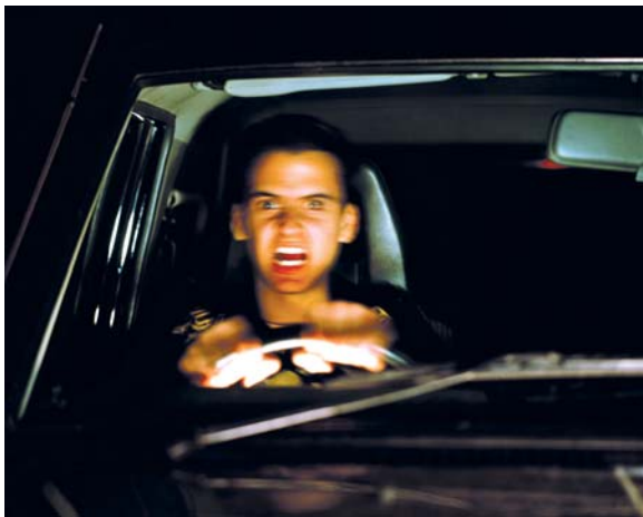
Agresivita pramenící z frustrace se někdy projevuje v záchvatech vzteku na silnici. Agresivita řidičů je důsledkem bojovného a negativního chování jiných řidičů, například v zácpě nebo koloně aut (Britt & Garrity, 2006).

Překážka v jednání, kterým se chceme dobrat k cíli.