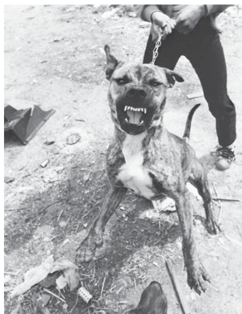
Geny předurčují schopnost pitbulů být agresivní.

Studie 12,5 milionu stálých obyvatel Švédska ukázala, že jedinci, jejichž genetickému sourozenci byl prokázán trestný čin, byli sami čtyřikrát náchylnější ke spáchání trestného činu. Čísla byla mnohem nižší u adoptovaných sourozenců, což naznačuje silný vliv dědičných prvků a malý vliv sociálního prostředí (Frisell & kol., 2011). Dlouhodobé studie sledující několik set novozélandských dětí ukazují, že recept na agresivní chování spočívá v kombinaci hrubého zacházení a genu, jenž řídí rovnováhu mezi nervovými přenašeči (Caspi & kol., 2002; Moffitt & kol., 2003). Nejsou to ani „špatné“ geny, ani „špatné“ prostředí, co by samo o sobě předurčovalo pozdější agresivitu či asociální chování. Spíše jde o to, že geny předurčují některé děti k větší vnímavosti a citlivosti vůči hrubému zacházení. Povaha dítěte a jeho výchova působí vzájemně.